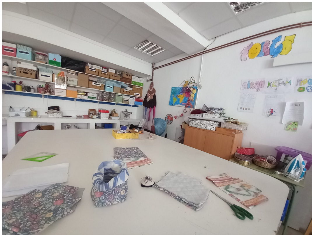
Aula per alunni con disabilità