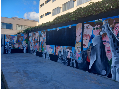
Campi esterni, aree gioco